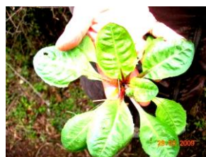
Pissenlit à feuille luisante