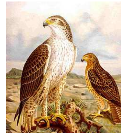
Aigle de Bonelli