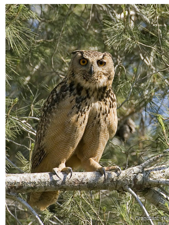
Grand Duc d'Europe