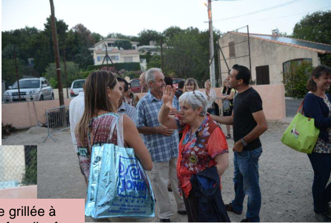
Saucisse grillée à point sur feu d'enfer