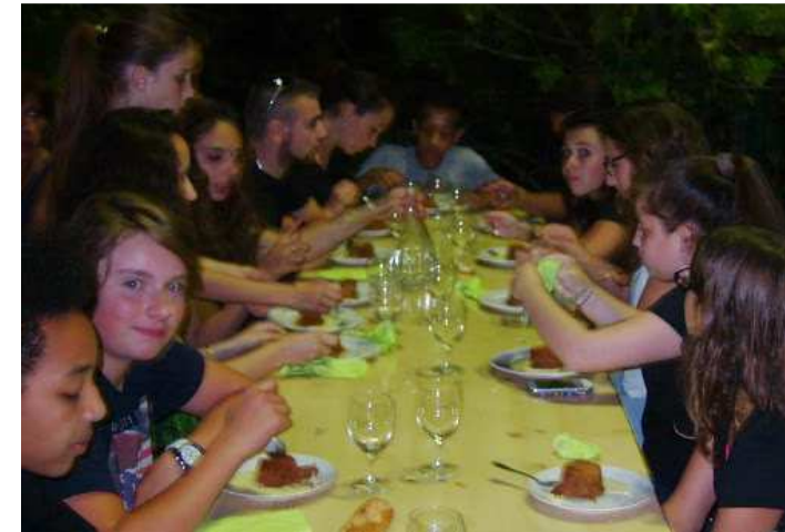
Très efficace la jeune équipe qui a servi le repas