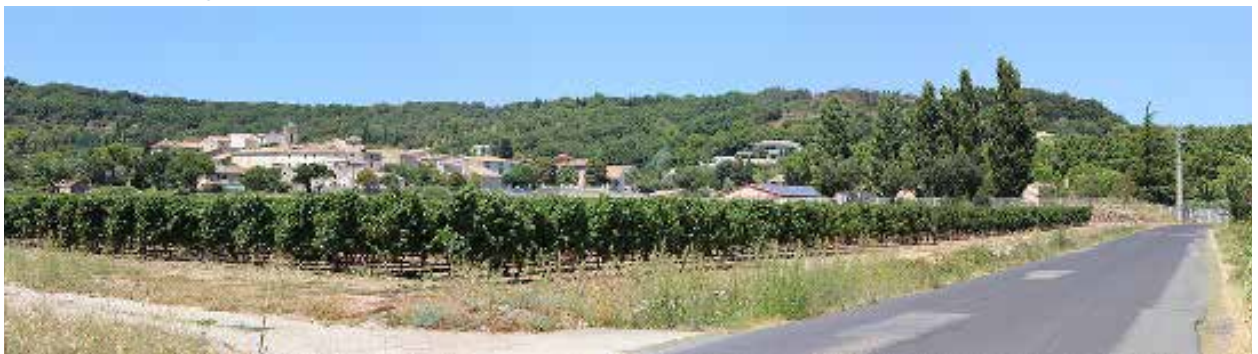
Vue sur le village depuis le RD128, au Sud