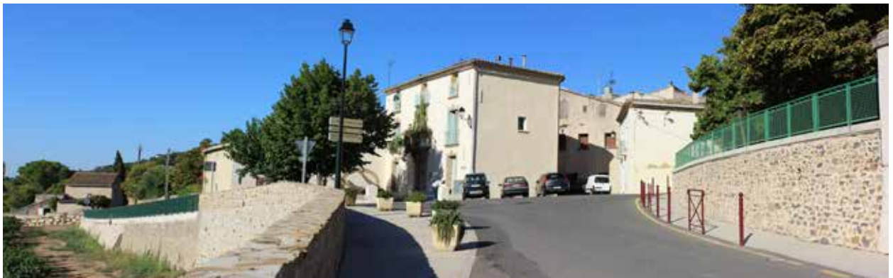
Positionnement du village en belvédère, mur de soutien du centre