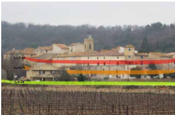
Principe d'organisation du village