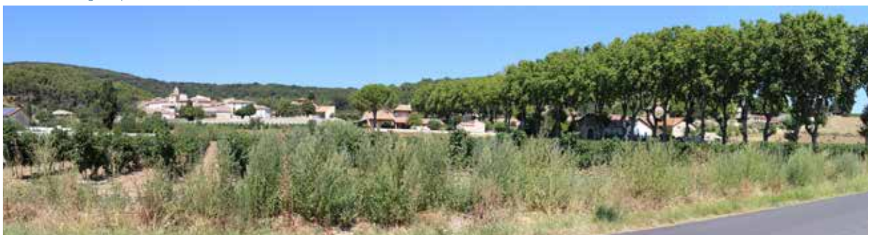
Vue sur le village depuis la RD128, au Nord vers l'allée des platanes