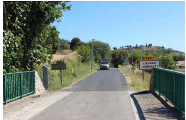
Vue depuis l'entrée