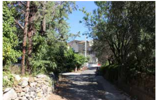
Chemin ruisseau de Peyrigous, à l'Ouest

L'intervention sur cette parcelle doit donc tenir compte de ces éléments :