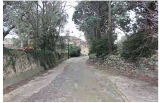
Chemin ruisseau de Peyrigous, à l'Ouest