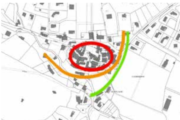
Principe d'organisation du village

Le village ancien s'est organisé en fonction du relief, sur 3 niveaux :