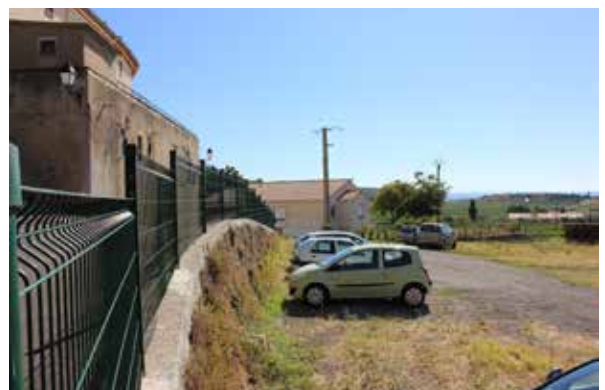
Dénivelé / rapport au centre ancien