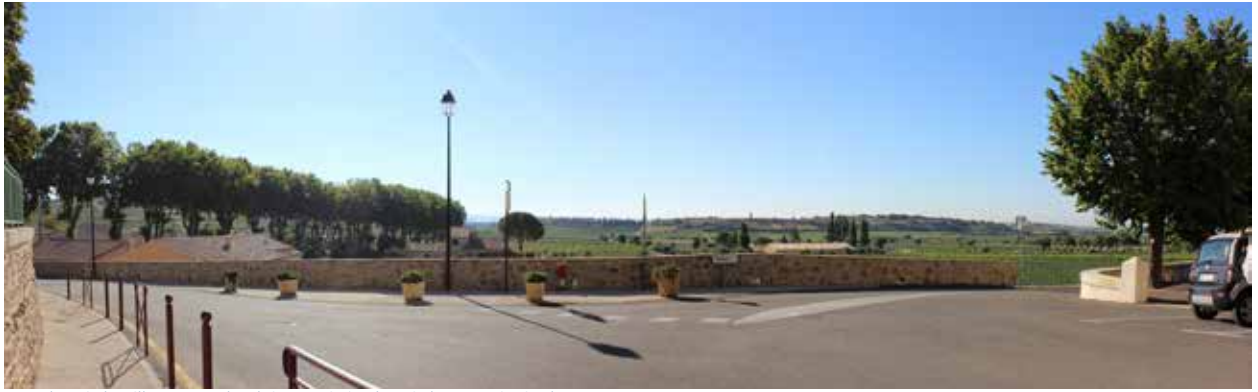
Vue depuis le village, vers la plaine, arrivée depuis la rue principale