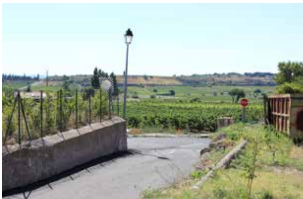
Accès principal, sens sortant