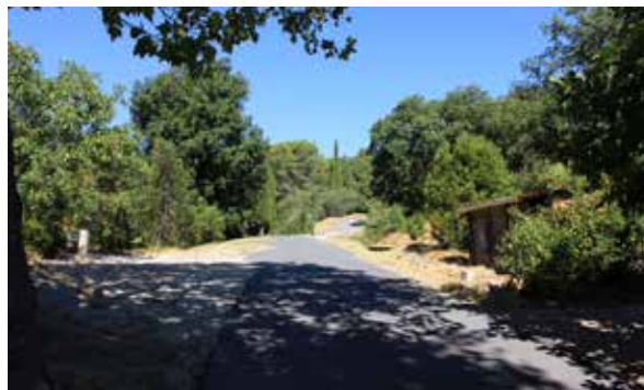
Chemin vers le cimetière