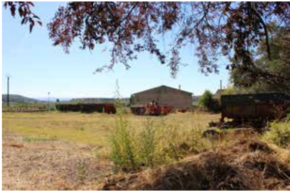
Intérieur du terrain

La parcelle en contre-bas du village, parcelle 347, occupe une position stratégique au regard de sa proximité du centre ancien, mais aussi au regard de sa place dans la topographie et sa participation à la silhouette du village.