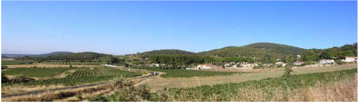
Le village et son rapport à la plaine, lien créé par l'alignement de platanes