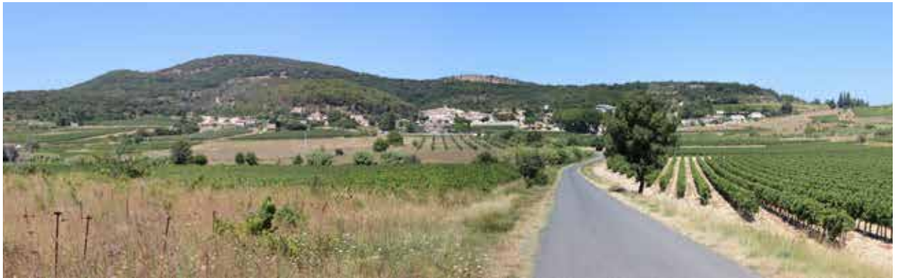
Organisation du village, rapport à la plaine