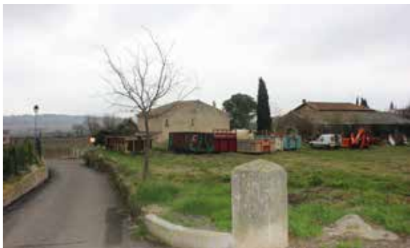
Terrain et accès principal