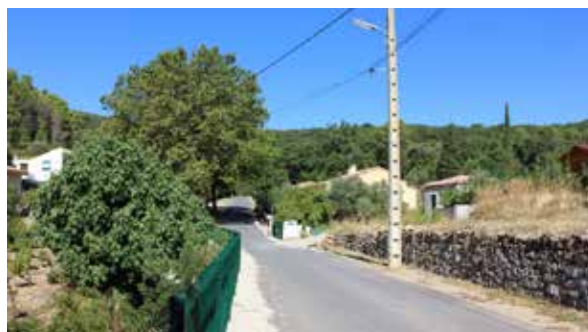
Sortie du village en direction du cimetière

La priorité est donc de préserver cette épaisseur végétale entre la route et les futures constructions. Le chemin existant est à préserver ainsi que la végétation qui le borde. Une desserte interne permettra de ne pas démultiplier les percées dans cet écran boisé et de les limiter à un accès aux deux extrémités.