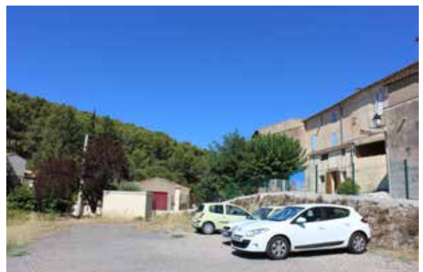
Dénivelé / rapport au centre ancien