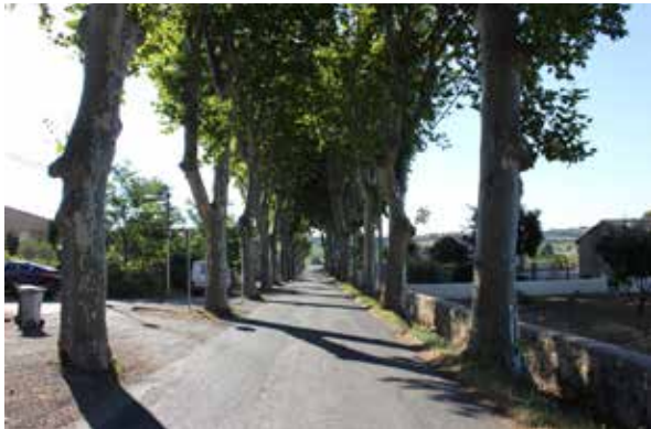
L'allée de platanes

Plus près du village, cette force est accentuée par le mur qui «soutient» le village et qui crée une limite nette entre vignes et village ancien et conforte sa position dominante.