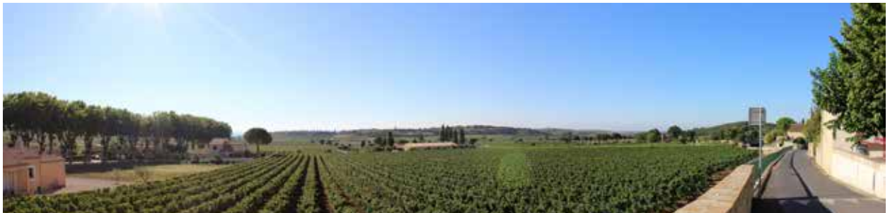
Vue depuis le village, vers la plaine