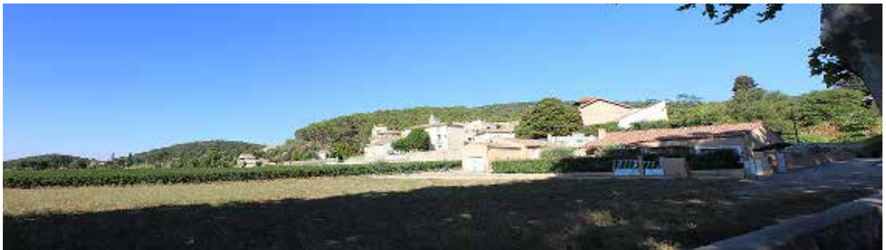
Vue sur le village depuis l'allée des platanes

Des constructions se sont implantées le long de l'allée des platanes, mais une belle et grande ouverture permet encore de mettre en scène le village.