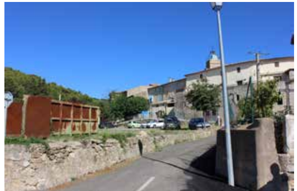
Dénivelé / rapport au centre ancien