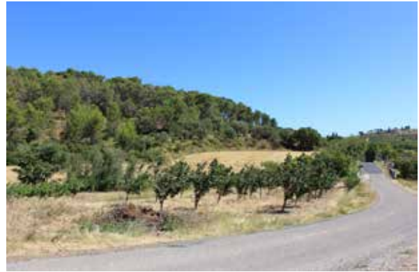
Vue depuis entrée route de Péret