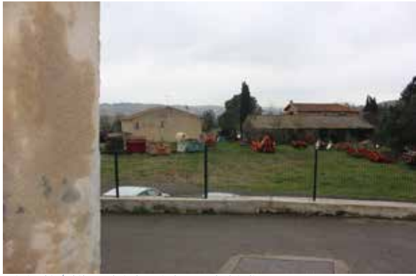
Dénivelé / débouché depuis la rue de l'église

La parcelle en contre-bas du village, parcelle 347, occupe une position stratégique au regard de sa proximité du centre ancien, mais aussi au regard de sa place dans la topographie et sa participation à la silhouette du village.