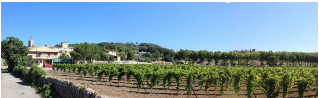
Vue sur le village depuis les petits jardins